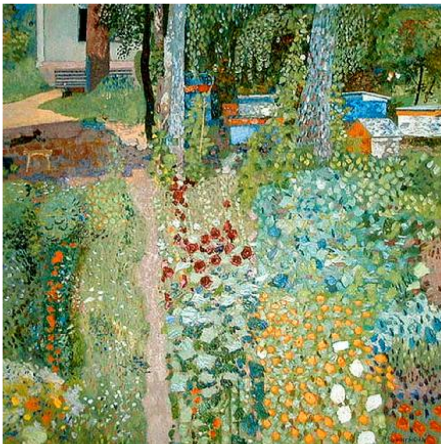
Худ. В. Зарецкий