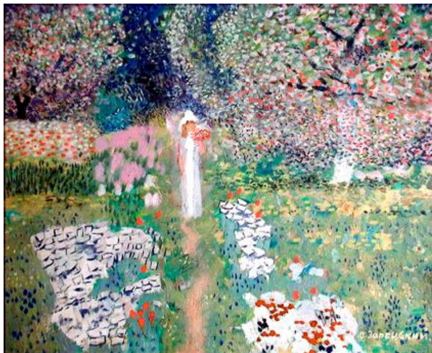
Худ. В. Зарецкий