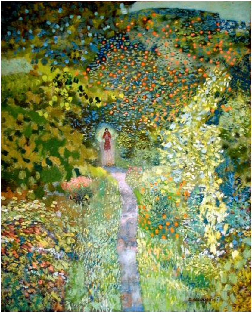
Худ. В. Зарецкий