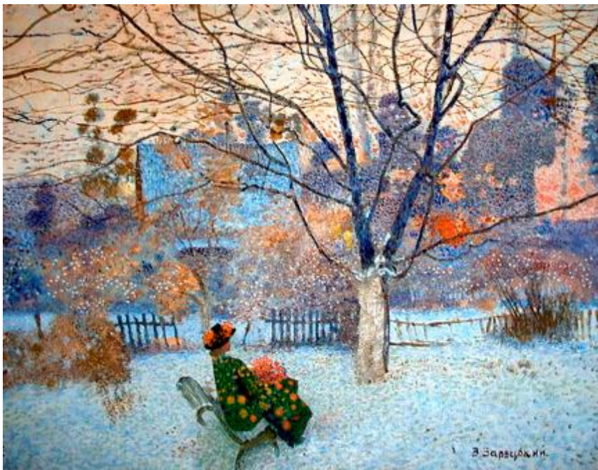
Худ. В. Зарецкий