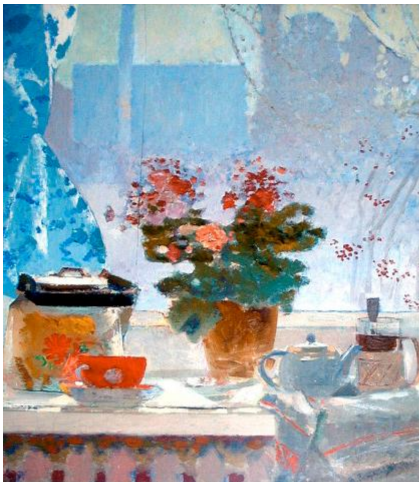
Худ. В. Зарецкий